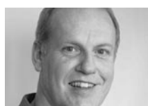
Martin Stalder Ressortleiter höhere Berufsbildung, Bundesamt für Berufsbildung und Technologie (BBT), Bern

Um die Ziele des Kopenhagen-Prozesses erreichen zu können, hat die EU eine Reihe von Instrumenten entwickelt. Das zentrale Instrument ist dabei die Entwicklung eines Europäischen Rahmens der Qualifikationen ( European Qualifications Framework, EQF )