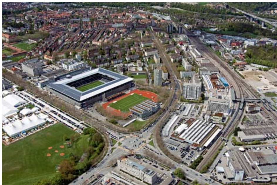
Die Finanzierung von Bahn- und Strasseninfrastrukturen kann nicht mehr getrennt betrachtet werden. Für eine nachhaltige, zukunftsweisende Finanzierung der Verkehrsinfrastrukturen ist ein neues Finanzierungskonzept erforderlich.

Eine gute Verkehrsinfrastruktur ist ein wichtiger Standortfaktor. Weil der Ausbau jedoch kostenintensiv ist, müssen nebst Kosten-Nutzen-Überlegungen auch die finanziellen Möglichkeiten des Staates berücksichtigt werden. Economiesuisse fordert daher für die Zukunft auch für die Schieneninfrastruktur eine verursachergerechtere Verkehrsfinanzierung, welche falsche Anreize zu verhindern hilft.