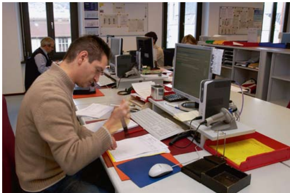
Gemäss der Studie haben gut ausgestattete E-Zoll-Dienste ein grosses Potenzial, den Aufwand der Unternehmen zur Abwicklung der Zollformalitäten zu verringern. Damit könnten auch die Wettbewerbsnachteile gegenüber Konkurrenten aus dem EU-Raum reduziert werden.

Die Reichweite und Prioritäten für E-Zoll-Dienste werden dabei thematisiert.