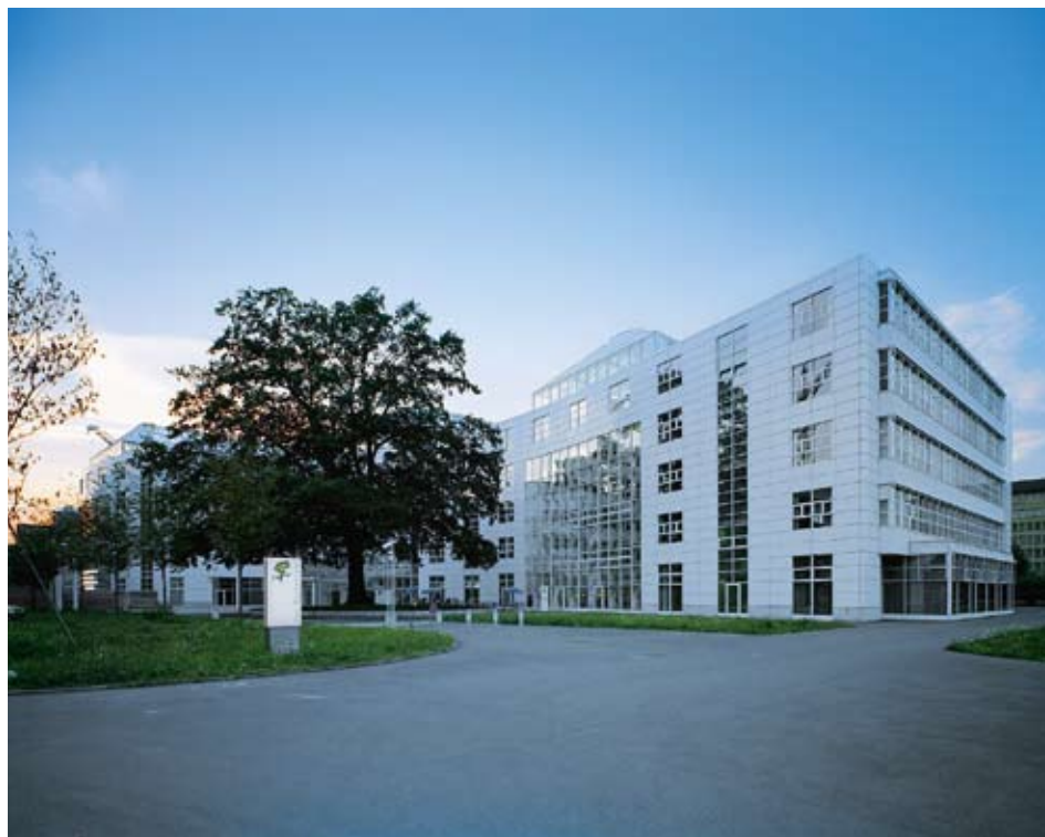
Le canton de Zoug sert de laboratoire en matière d'aménagement du territoire et cherche plus particulièrement à découpler la croissance de la population et de l'emploi de celle des zones bâties. En illustration: le complexe d'habitation et professionnel Grafenau à Zoug.