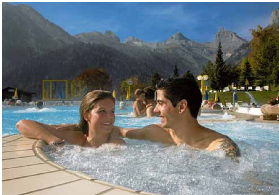
L'importance du tourisme est primordiale pour le canton du Valais. La nouvelle stratégie de développement économique adoptée par son gouvernement continue de lui faire la part belle, mais souhaite aussi attirer les entreprises dans toutes les régions du canton. En illustration: bains thermaux à Ovronnaz.

De par sa nature de canton alpin, le Valais présente certaines spécificités topographiques; ces dernières ont fondamentalement influencé tant l'occupation de son territoire par l'être humain que son développement économique. Pour tenir compte de ces particularités, le canton du Valais a mandaté en 2009, en préambule à l'élaboration de sa stratégie de développement économique, une analyse exhaustive des différentes dimensions socio-économiques de son espace.