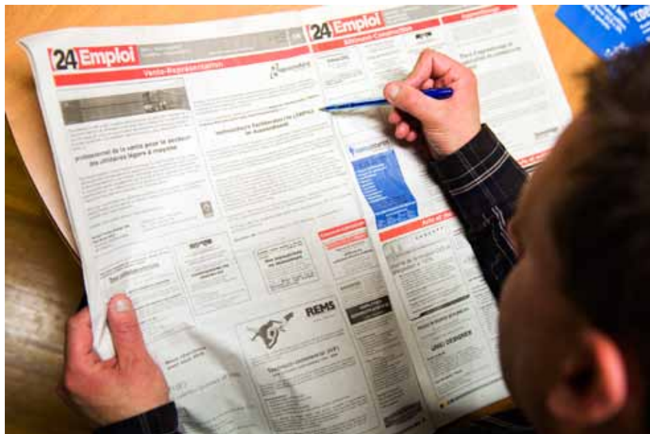
Mit zunehmender Dauer der Arbeitslosigkeit steigt das Risiko einer länger anhaltenden oder dauerhaften Abhängigkeit von Sozialleistungen erheblich an.

Beziehen erstmals oder erneut arbeitslos gewordene Personen länger und öfter Sozialleistungen? Um welche Sozialleistungen handelt es sich, und wie lange dauern die Bezugsperioden? Anhand eines neuen Datensatzes mit Angaben aus der Arbeitslosenversicherung, der Invalidenversicherung und der Sozialhilfe sind erstmals die Leistungsbezüge von neuen Beziehenden von Arbeitslosenentschädigung während einer Periode von sechs Jahren untersucht und anhand von Risikoprofilen charakterisiert worden.