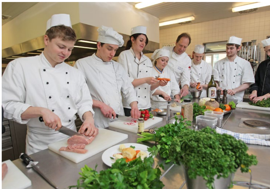
Berufsschulunterricht angehender Köche in Flensburg. Das Berufsbildungssystem Deutschlands ist gemäss KOF Jugendarbeitsmarktindex punkto Qualität und Integrationsleistung vergleichbar mit demjenigen der Schweiz.

Jugendarbeitslosigkeit ist trotz verbesserter Bildung spätestens seit der letzten Wirtschaftskrise zum weltweiten Thema geworden. Nur wenigen Ländern gelingt es, ihre Jugend effizient und deren Ausbildung entsprechend in den Arbeitsmarkt zu integrieren. Die Schweiz ist international ein Vorzeigeland, weshalb sich viele Staaten für die Ursachen dieses Erfolgsmodells interessieren. Dabei spielt die Berufsbildung eine wichtige Rolle. Die folgenden Ausführungen zeigen auf, wie die Situation der Jugend auf dem Arbeitsmarkt erfasst werden kann und welche Herausforderungen sich beim Vergleich von Berufsbildungssystemen stellen.