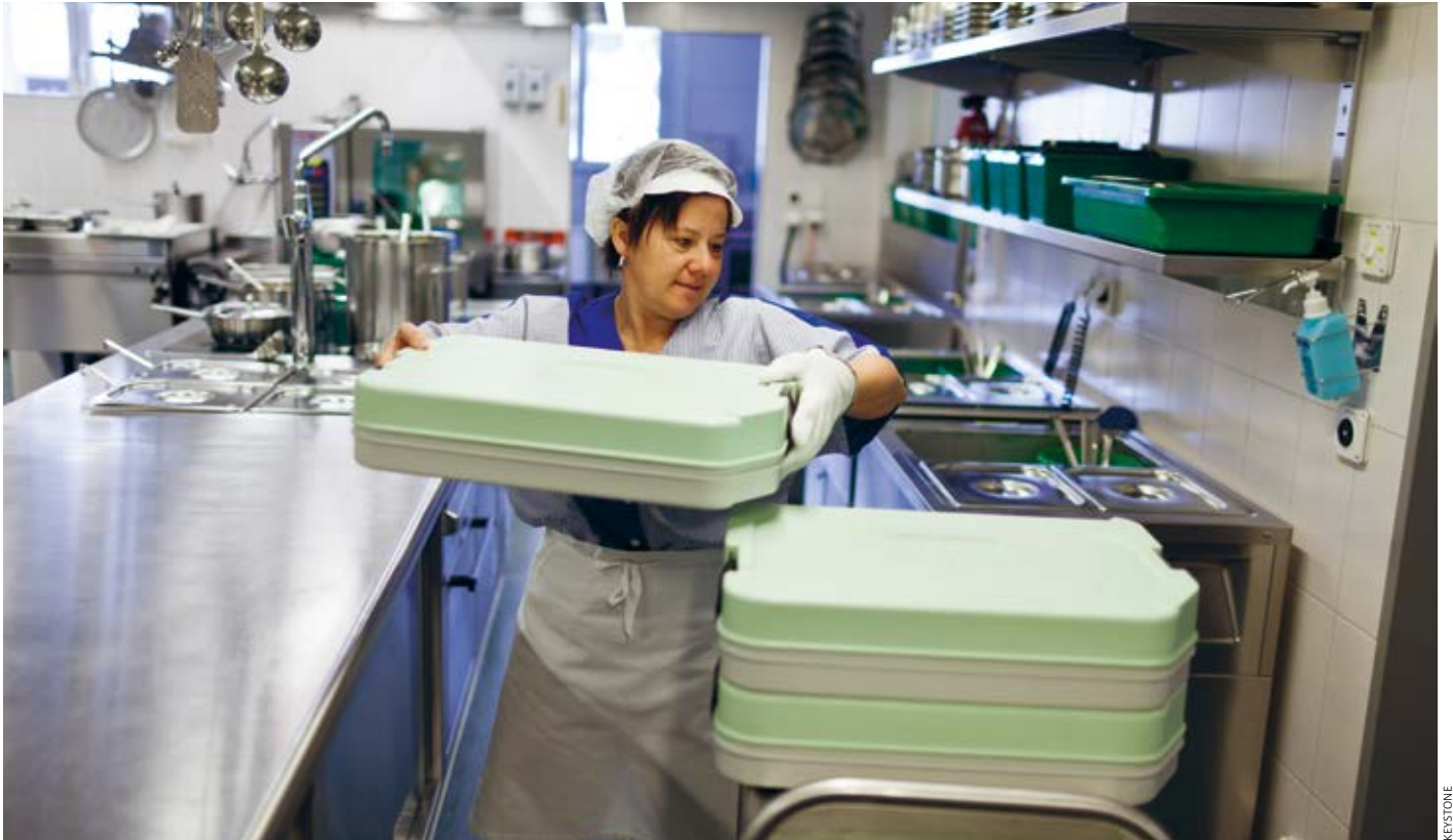
Les coûts de la santé augmentent fortement. Cuisine d'hôpital dans le val Müstair (GR).

qui est des soins de longue durée. En revanche, les dépenses effectuées à ce titre devraient grever le budget des communes dans une moindre mesure (+ 0,4 % du PIB d'ici à 2045), l'augmentation tenant principalement aux soins de longue durée.