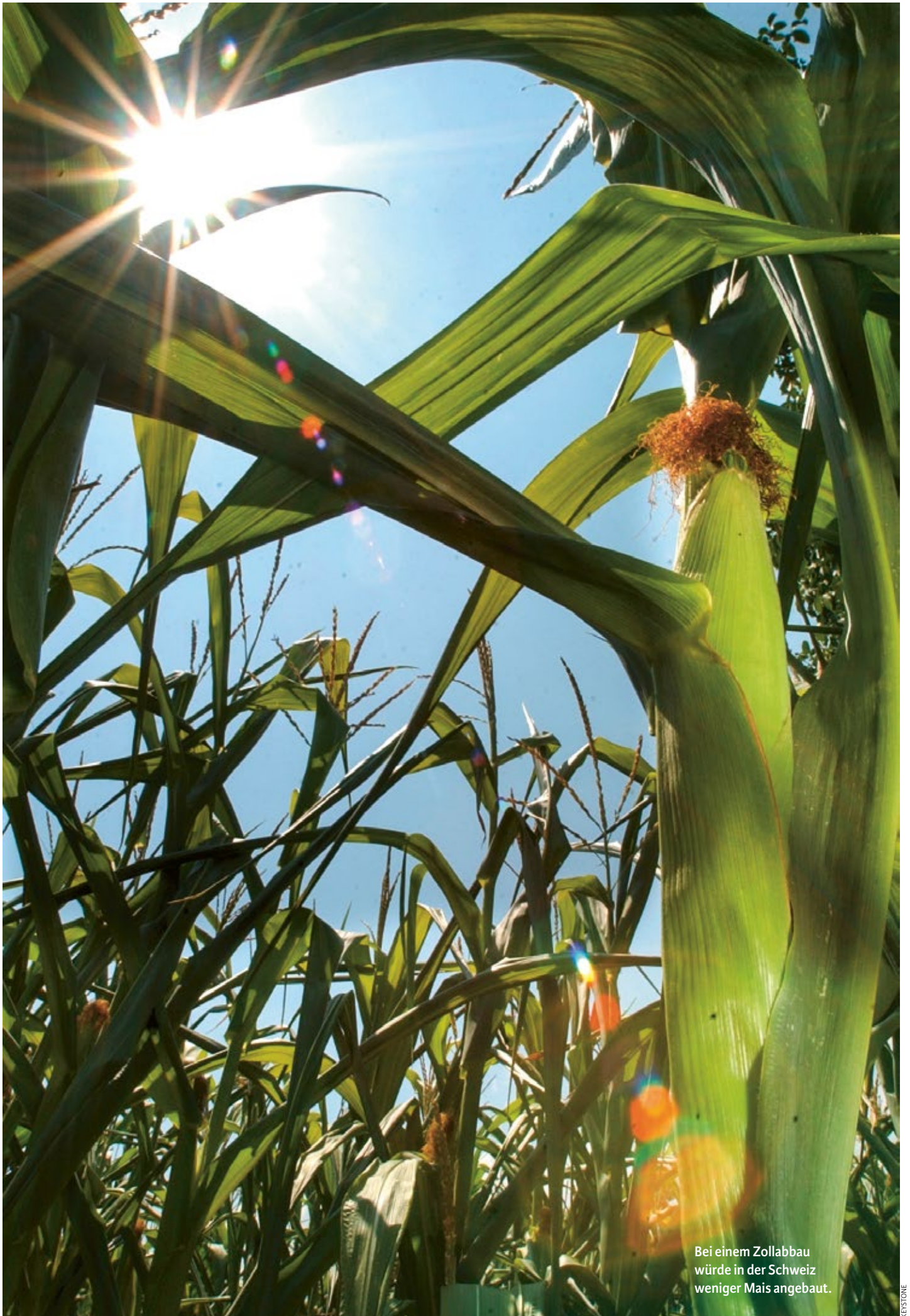
Bei einem Zollabbau würde in der Schweiz weniger Mais angebaut.