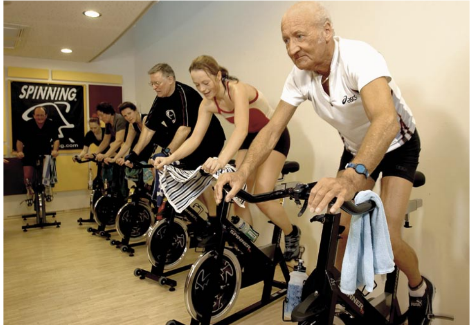
Damit die wachsende Zahl von älteren Erwerbstätigen die erforderliche hohe Arbeitsfähigkeit aufweisen wird, muss bereits heute etwas für die Beschäftigten getan werden. Dies beinhaltet zum Beispiel die Gesundheitsförderung und die leistungsgerechte Gestaltung der Anforderungen in allen Phasen des Erwerbslebens.

Die Forderung, dass Erwerbstätige länger im Arbeitsprozess bleiben sollen, ist nur dann glaubwürdig, wenn die Arbeitsbedingungen und die Gesundheit am Arbeitsplatz dies auch erlauben. Diese Ziele realisieren sich nicht von selbst, sondern müssen durch ein Zusammenwirken aller Beteiligten – auch des Staates – erreicht werden. Gerade weil die Schweiz eine hohe Erwerbstätigkeit älterer Arbeitnehmender aufweist, ist in unserem Land auf staatlicher Ebene bisher zu wenig geschehen. Die Erfahrungen anderer Länder – insbesondere von Finnland – zeigen aber auf, dass neben dem Abbau der Segregation älterer Arbeitnehmender wirtschaftliche Effizienzgewinne zu bescheidenen Programmkosten erreicht werden können.