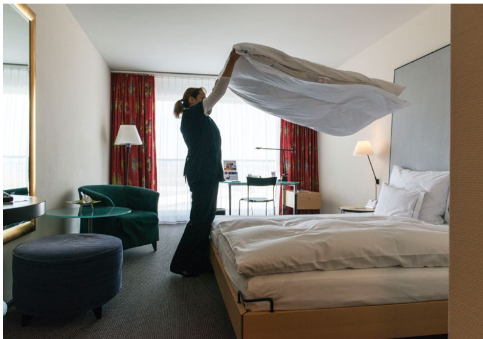
Les adultes sans formation postobligatoire peuvent accroître leur employabilité en obtenant un titre professionnel.

Étant donné la rapide mutation du marché du travail et l'accroissement général du niveau de qualification exigé, il est de plus en plus important pour les adultes de disposer d'une formation professionnelle initiale. C'est pourquoi la Confédération, les cantons et les organisations du monde du travail veulent optimiser les conditions dans lesquelles se déroulent l'acquisition d'une formation professionnelle et un changement de profession pour les adultes. Il s'agit d'augmenter le taux de titres obtenus.