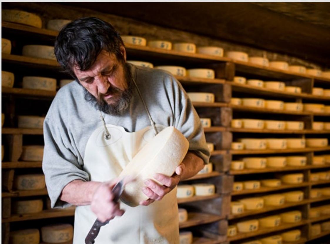
Le projet Alpfoodways réunit plusieurs pays présents dans l'espace alpin. Son objectif est d'ajouter le patrimoine alimentaire de la région à la liste de l'Unesco.

Après une quinzaine d'années de coopération au sein du programme Interreg, les régions et les États alpins ont voulu donner une dimension politique à une coopération déjà bien vivante au niveau technique. Ils ont adopté en 2015 une Stratégie macrorégionale pour la région alpine (Eusalp), afin de mieux coordonner les politiques publiques des différents niveaux étatiques.