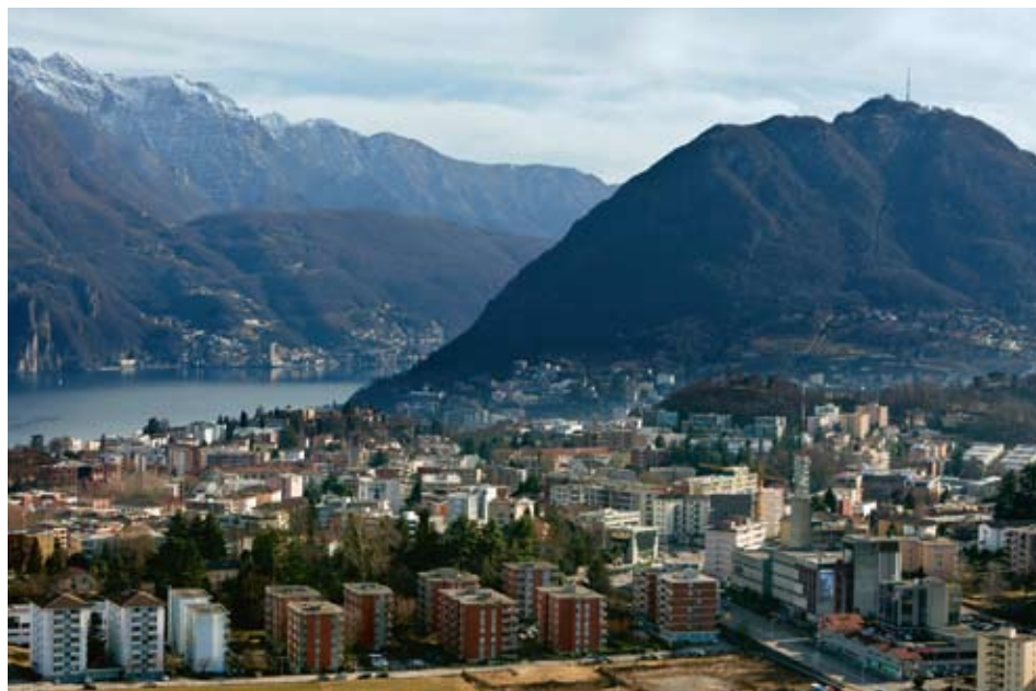
Avec un taux de 40%, Lugano fait partie des villes de Suisse qui connaissent la plus forte proportion de population étrangère. L'analyse avait pour objet de mettre en lumière les préférences des ménages quant aux nationalités habitant dans leur voisinage et à la concentration d'étrangers dans le même quartier de domicile.