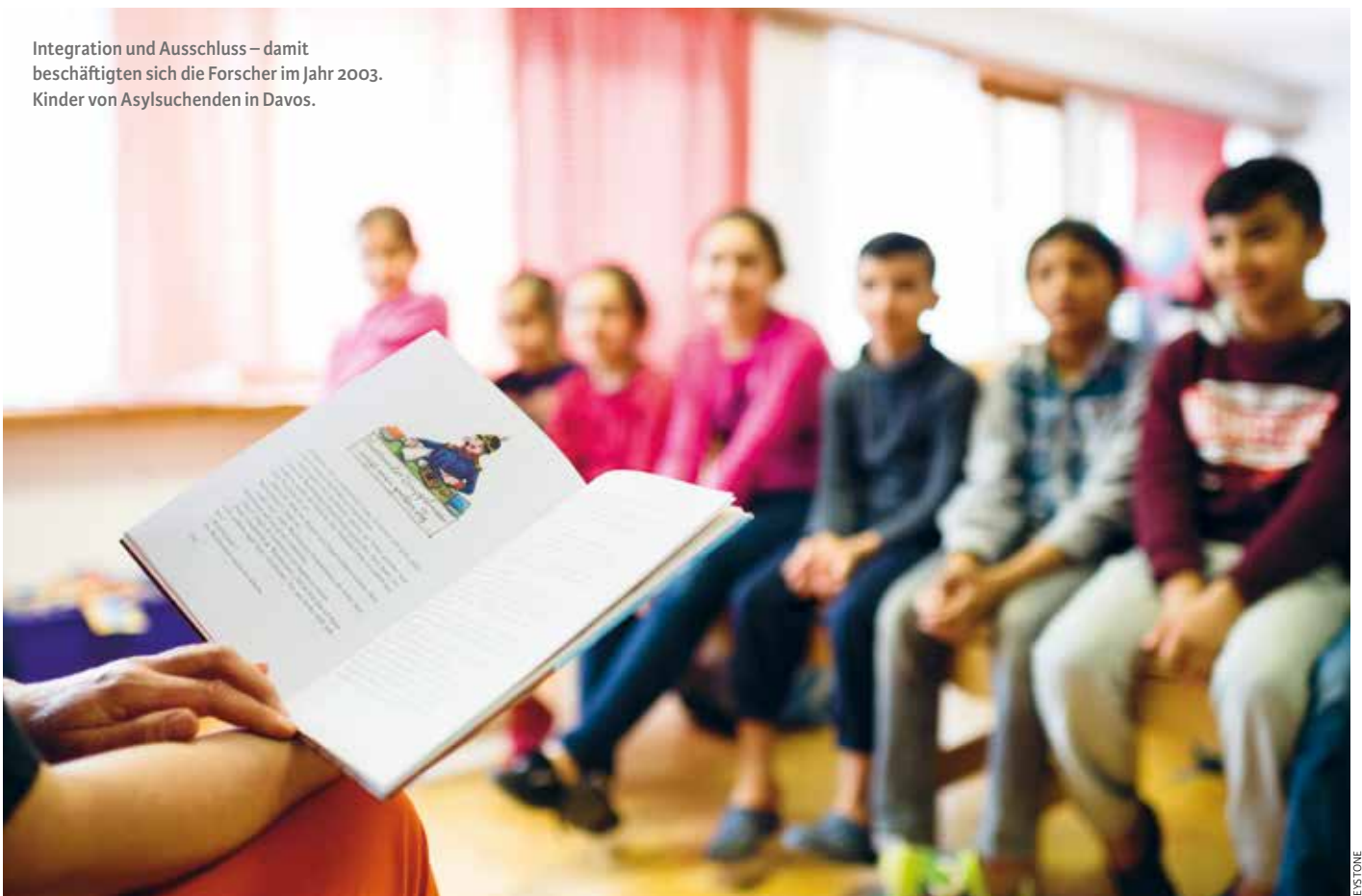
Integration und Ausschluss – damit beschäftigten sich die Forscher im Jahr 2003. Kinder von Asylsuchenden in Davos.