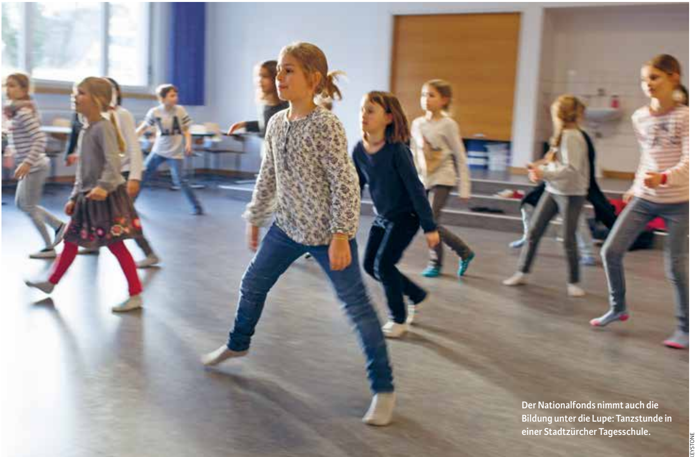
Der Nationalfonds nimmt auch die Bildung unter die Lupe: Tanzstunde in einer Stadtzürcher Tagesschule.