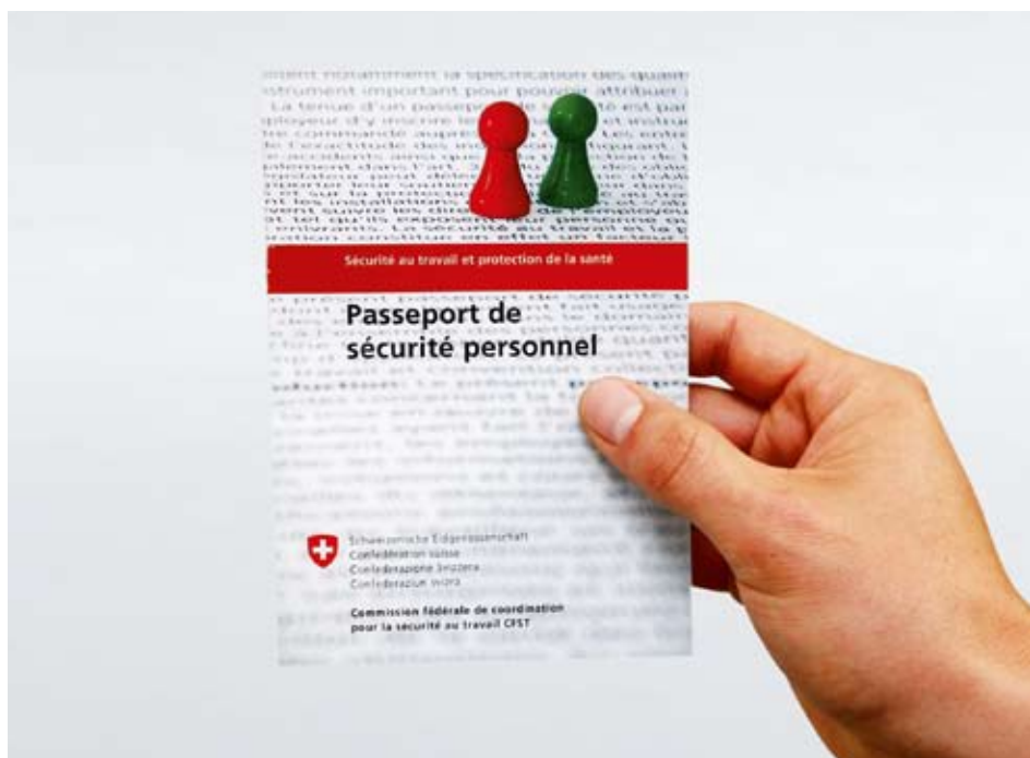
Le passeport de sécurité de la CFST, un outil de prévention efficace dans le domaine de la sécurité au travail et de la protection de la santé.

La Commission fédérale de coordination pour la sécurité au travail (CFST) a créé deux nouveaux outils de prévention: le «passeport de sécurité personnel» et un DVD présentant des situations dangereuses. Le passeport de sécurité de la CFST sert à répertorier les séances d'instruction et les formations suivies. Il permet aux responsables au sein de l'entreprise de déterminer rapidement si un travailleur dispose des qualifications requises et des connaissances nécessaires. Le DVD Situations dangereuses est utilisé à des fins de formation et montre, au moyen d'illustrations explicites, comment éviter des accidents.