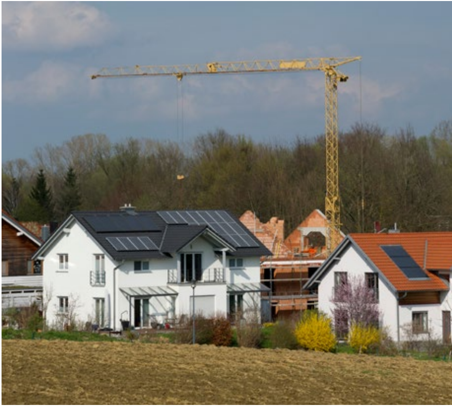
Le marché du logement s'est nettement détendu à la campagne.

Dans les cinq plus grandes villes du pays, le taux de logements vacants se situe entre 0,14 % (Lausanne) et 0,50 % (Genève). Au niveau des agglomérations, il va de 0,30 % (Lausanne) à 0,96 % (Berne). Le taux moyen s'établit à 1,02 % dans les communes de plus de 5000 habitants, alors que, à l'autre extrême, un logement sur dix est déclaré vacant dans certaines communes rurales.