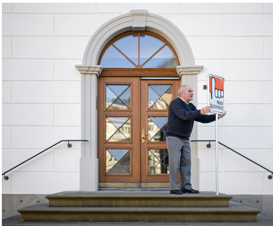
Abstimmungstafel vor dem Gemeindehaus in Glarus – einem der drei verbliebenen im Kanton.