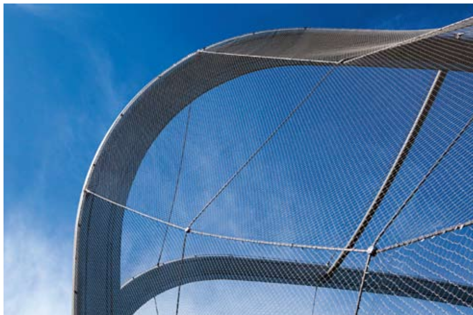
La technologie de pointe des entreprises bernoises est appréciée dans le monde entier. Photo: des enclos en inox à Buenos Aires, construits par l'entreprise Jakob à Trubschachen, spécialisée dans les systèmes de câbles.

Le canton de Berne est celui qui emploie le plus de travailleurs dans l'industrie de transformation. Il abrite de nombreuses sociétés actives au niveau international. Sa capitale est le siège de l'administration fédérale et des entreprises appartenant à la Confédération. De surcroît, Berne est un important canton touristique. Tout cela crée un tissu économique très diversifié qui présente de nombreux atouts, mais pose aussi de grands défis à la politique cantonale. Le canton de Berne veut utiliser sa marge de manœuvre pour consolider l'économie et améliorer la prospérité. Sa stratégie économique 2025 montre comment il compte y parvenir.