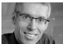
Pr Peter Moser Professeur d'économie politique, Hochschule für Technik und Wirtschaft (HTW), Coire

Les formalités douanières, les temps d'attente à la frontière, les règles des pays d'origine et les inconvénients qu'entraîne l'autorisation des produits renchérisent donc les exportations comme les importations. Le tableau 1 résume les résultats de l'enquête menée auprès des entreprises; en moyenne, les frais de passage en douane correspondent à quelque 1,9% de la vente des marchandises exportées vers l'UE et à 2,3% environ des dépenses consacrées aux marchandises importées de l'espace communautaire. Ne sont pas compris dans ces chiffres – car impossibles à quantifier – les coûts d'entreposage supplémentaires et les