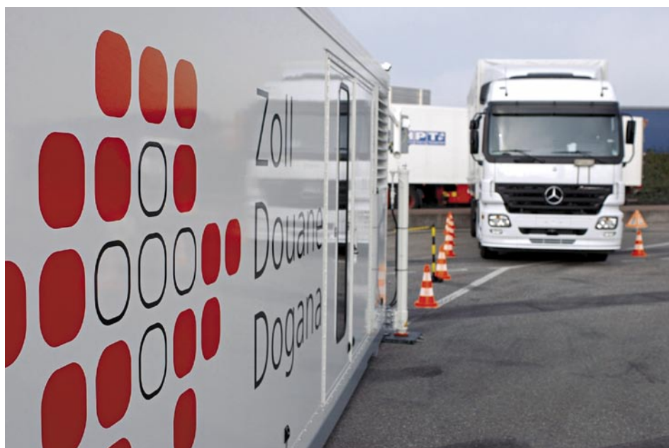
Chaque passage transfrontalier doit être annoncé aux services douaniers. Les coûts de dédouanement pèsent aussi sur les quelque 80% d'importations pour lesquels aucun droit ne doit être acquitté.

Le franchissement de la frontière suisse occasionne des coûts élevés aux entreprises et renchérit les exportations aussi bien que les importations. Pour la première fois, une vaste enquête réalisée en Suisse permet de cerner le coût des passages en douane pour notre économie. L'étude, commandée par Avenir Suisse, révèle qu'ils s'élèvent à quelque 4 milliards de francs de charges diverses, soit l'équivalent de 0,85% du PIB de notre pays. 1