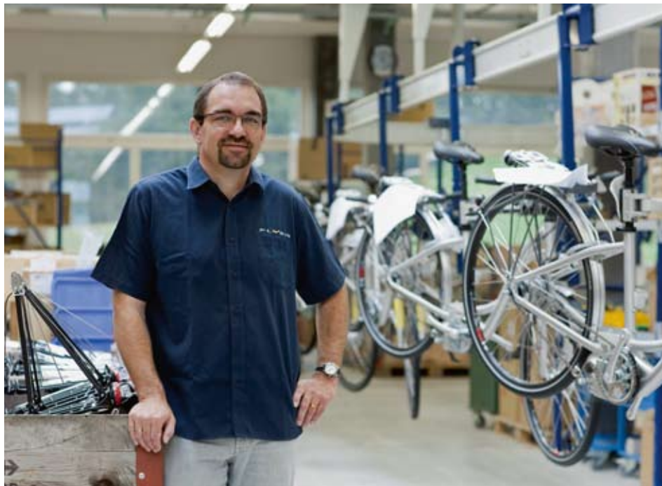
Die Schweiz weist punkto Verfügbarkeit von Venture Capital im Vergleich zur Weltspitze einen beträchtlichen Rückstand auf. Gerade in jungen, innovativen Unternehmen liegt indes viel Potenzial, um gestärkt aus der Krise hervorzugehen. Im Bild: Flyer-Elektrovelos als Beispiel eines erfolgreichen Start-ups.

Der Standort Schweiz verfügt grundsätzlich über sehr vorteilhafte Rahmenbedingungen für die Gründung junger und innovativer Unternehmen, die in ihrer Wirkung einen wesentlichen Beitrag zur systematischen und strukturellen Erneuerung der Volkswirtschaft leisten. Die unternehmerische Kultur, das gesellschaftliche Verständnis wie auch die politische Unterstützung sind indes drei Faktoren, die innovationshemmend wirken. Beim für die Verwirklichung marktfähiger Ideen verfügbaren (Risiko-) Kapital nimmt die Schweiz im internationalen Vergleich ebenfalls eine Position im Mittelfeld ein. Deshalb stellt sich die Frage, ob sich die Situation durch die Finanzkrise noch verstärkt und in welchem Bereich mögliche Chancen und Handlungsfelder identifiziert werden können.