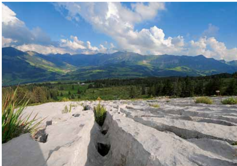
La réserve de biosphère de l'Entlebuch (en illustration) fait partie intégrante du programme de l'Unesco «L'Homme et la biosphère», dont le but est de développer des stratégies visant à assurer une utilisation durable des habitats et à préserver la diversité naturelle.

Des Alpes au Plateau en passant par les Préalpes, le canton de Lucerne embrasse des sites campagnards et des agglomérations dont l'attachement à la tradition rurale ou à la modernité urbaine sont inégaux. La politique économique cantonale est étroitement liée à cette diversité. Le rayonnement spécifique de Lucerne, national et international, lui vient avant tout de ses activités dans la culture, la formation et le tourisme, ainsi que de sa haute qualité de vie. Ce canton offre aussi un potentiel très particulier, qui demande à être mis en valeur et développé, aux industries à fort coefficient technologique, aux assurances sociales, aux instituts de sondage et aux petites entreprises culturelles créatives.