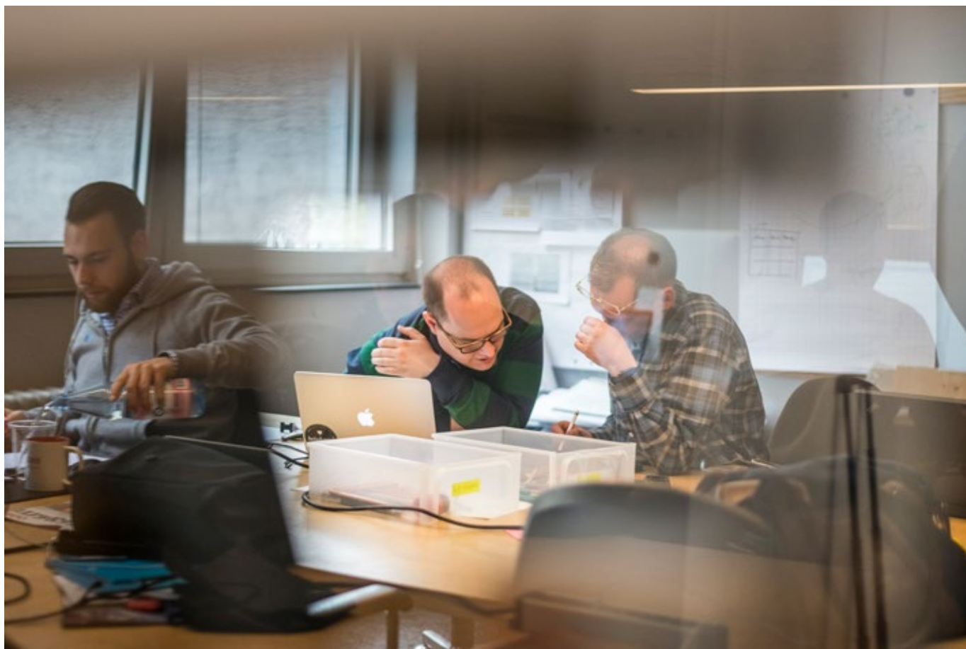
L'impôt sur le capital perçu par les cantons est particulièrement lourd pour les jeunes pousses.

d'importantes baisses de recettes dans certains cantons. C'est la raison pour laquelle le Conseil fédéral a renoncé à cette mesure.