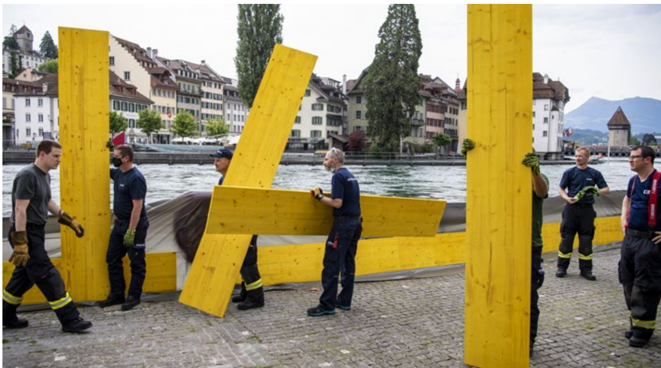
Le changement climatique entraîne-t-il une hausse importante des dépenses publiques ? Des pompiers construisent une digue contre les crues en juillet 2021 à Lucerne.

de la quote-part de l'État qui passe de 31,6 à 34,5 % (scénario optimiste) ou 35 % (scénario pessimiste) entre 2019 et 2050. Cette hausse s'explique presque exclusivement par les dépenses liées à la prévoyance vieillesse, à l'invalidité, à la santé, aux soins de longue durée et à la formation.