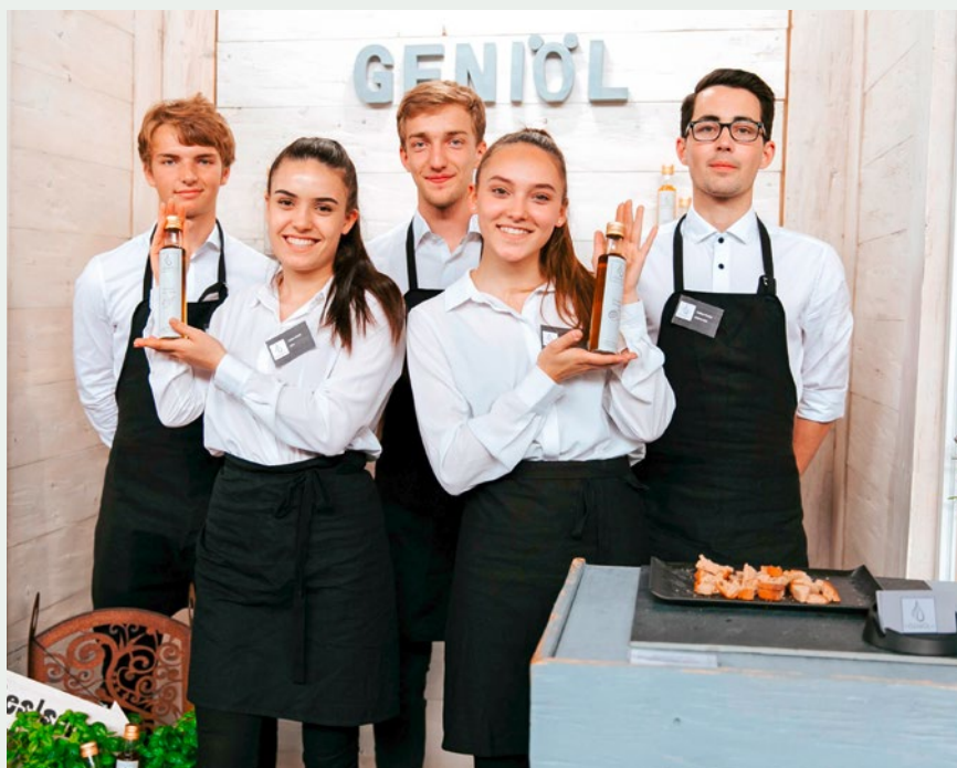
Des élèves du gymnase de Schiers (GR) présentent leur huile épicée lors de la finale du « Company Programme » à la gare centrale de Zurich.

courage de se lancer dans l'entrepreneuriat, leur apprendre les principes de l'économie et susciter leur enthousiasme pour l'innovation. Il est tout aussi important que les jeunes se sentent capables de transposer ces acquis dans leur future vie professionnelle et développent un vrai esprit d'entreprise. C'est ici que commence l'approche éducative du « Company Programme » qui se démarque des autres offres de formation du même genre: les sociétés des élèves sont réelles et ne sont ni un jeu de simulation ni une entreprise d'entraînement. Les jeunes assument ainsi de vraies responsabilités.