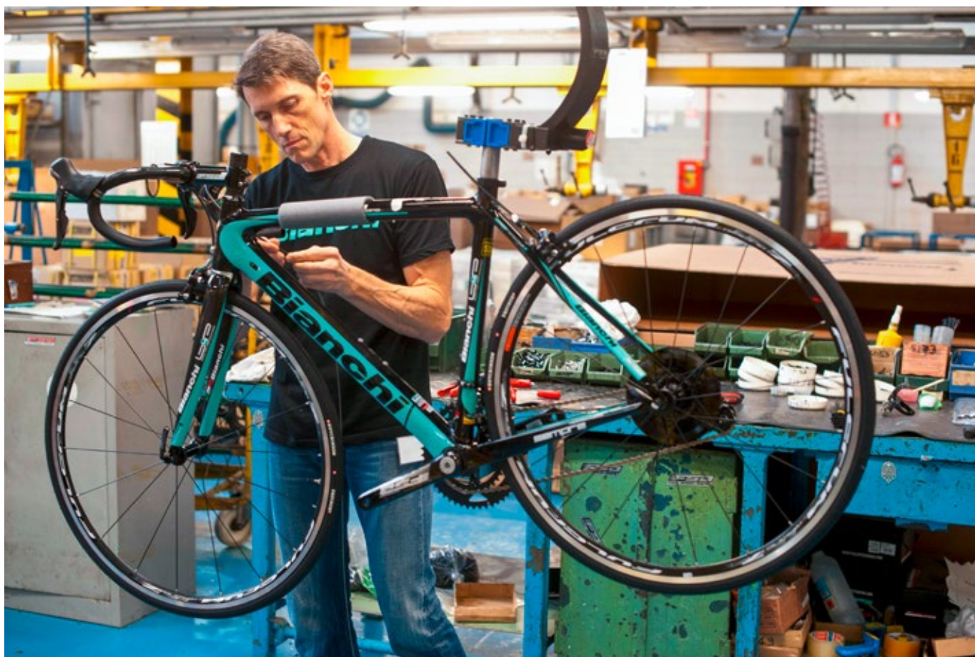
Les composants des vélos proviennent souvent d'Asie. L'usine Bianchi, à Treviglio, en Lombardie (Italie).

l'automatisation menace-t-elle effectivement les pays en développement ? Jusqu'à présent, des technologies comme l'automatisation et l'impression 3D n'ont eu que des effets positifs sur le commerce, en le stimulant et en améliorant la productivité. Des produits innovants comme les imprimantes 3D, les robots, les panneaux solaires et les batteries sont d'ailleurs fabriqués dans des chaînes de valeur mondiales.