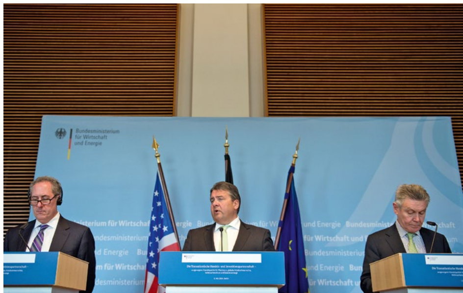
Le ministre de l'Économie allemand Sigmar Gabriel, entouré du représentant au commerce étasunien Michael Froman (à gauche) et du commissaire au commerce Karel de Gucht (à droite), lors d'une conférence de presse donnée suite aux tractations du TTIP du 5 mai 2014.

Les efforts déployés actuellement pour aboutir à un vaste accord sur le commerce et l'investissement entre l'Union européenne (UE) et les États-Unis ne manqueront pas d'affecter également la Suisse. À la demande du Secrétariat d'État à l'économie, le World Trade Institute de l'université de Berne a analysé les répercussions possibles d'un tel traité sur l'économie et les relations commerciales de notre pays. Les conséquences varient selon les scénarios.