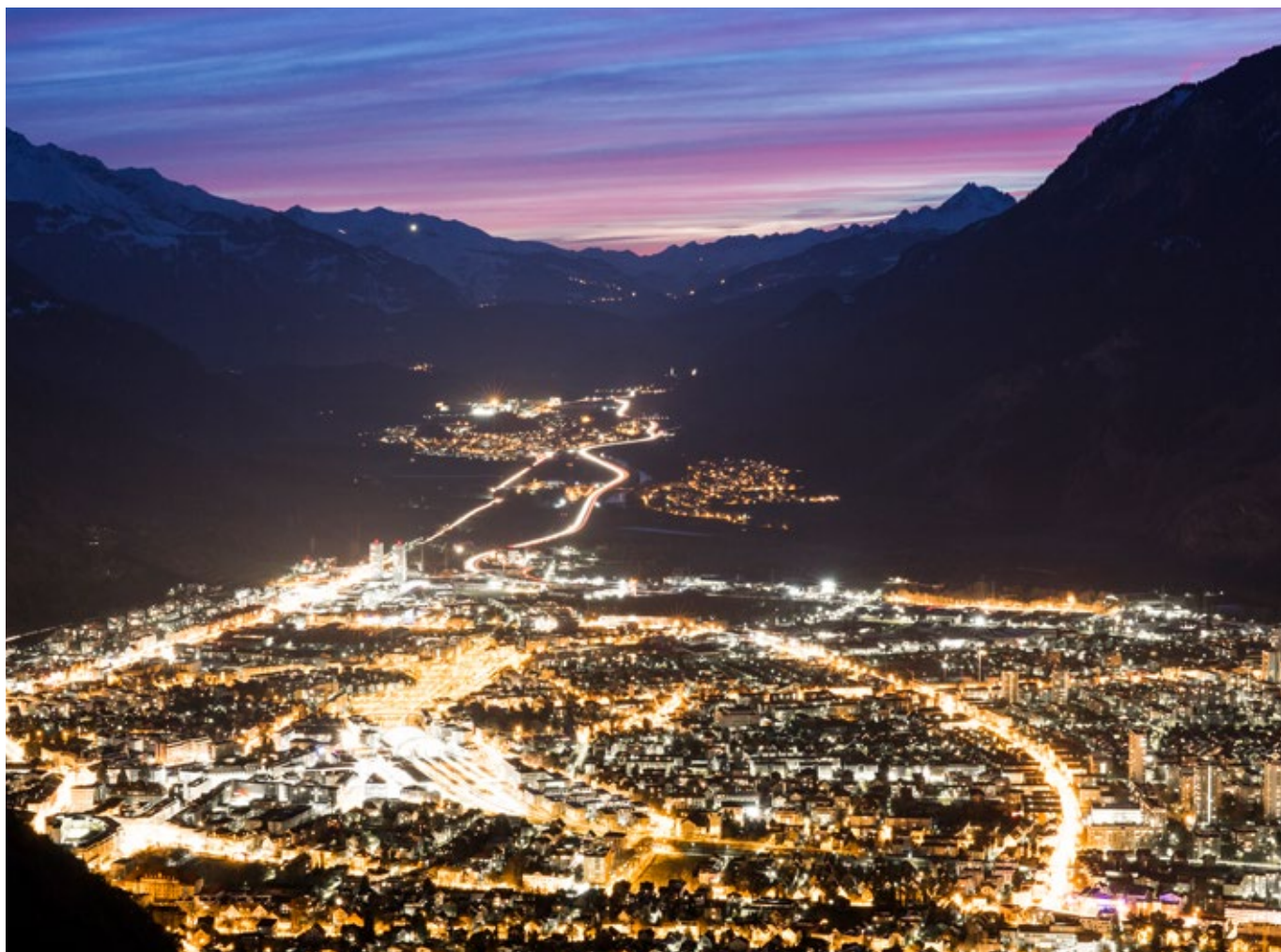
La capacité d'innovation de la région augmente grâce à l'École supérieure du sud-est de la Suisse. Une vue nocturne de Coire.