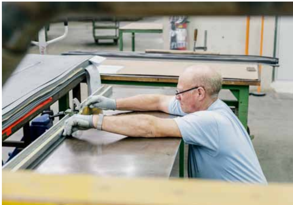
La majorité des travailleurs victimes de licenciements collectifs dans l'industrie retrouvent un emploi. Ceux de plus de cinquante ans ont, par contre, beaucoup plus de difficultés à se réinsérer.

Quelles sont les perspectives professionnelles des salariés qui perdent leur emploi en raison de la fermeture d'un établissement industriel en Suisse? Une enquête de l'université de Lausanne montre que, deux ans après leur licenciement, plus des deux tiers des personnes concernées avaient retrouvé un emploi. Les travailleurs d'un certain âge ont, par contre, beaucoup de peine à se réinsérer. Quand une usine ferme, un âge avancé constitue manifestement un handicap plus grave que le manque de qualifications pour se réinsérer.