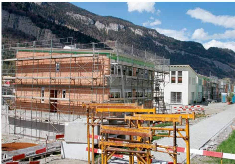
À y regarder de plus près, on s'aperçoit que le faible taux de propriétaires en Suisse recouvre des situations très diverses. En illustration: zone résidentielle à Coire.