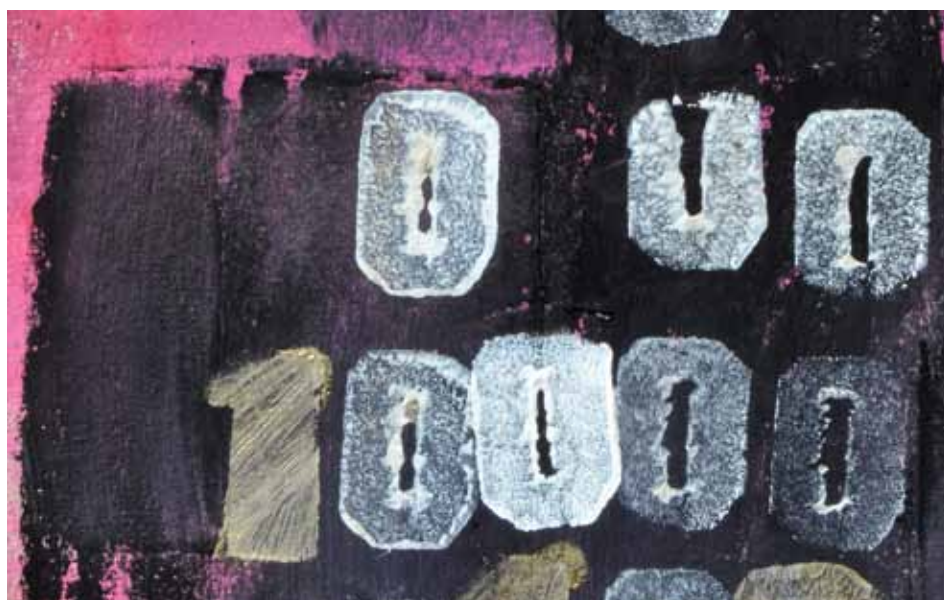
Der Anstieg der Sparquoten hat dazu beigetragen, dass sich das Volksvermögen der Schweiz seit 2000 dynamischer entwickelt hat als das BIP. So ist die Relation vom Volksvermögen zum BIP zwischen 2000 und 2010 von 4,4 auf 4,8 angestiegen.