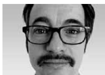
Antoine Lukac Bereich Personenfreizügigkeit und Arbeitsbeziehungen, Staatssekretariat für Wirtschaft SECO, Bern

Das Freizügigkeitsabkommen mit den EU/Efta-Staaten (FZA) erleichtert den Schweizer Unternehmen die Rekrutierung und Einstellung ausländischer Arbeitskräfte. Damit erweitern sich die Wachstumsmöglichkeiten der Unternehmen, welche in früheren Aufschwungphasen oft relativ rasch durch einen Fachkräftemangel eingeschränkt waren. Der Schweizer Arbeitsmarkt erwies sich in den letzten elf Jahren als aufnahmefähig, und negative Auswirkungen auf die ansässige Bevölkerung blieben relativ eng begrenzt. In den letzten beiden Jahren nahm die Zuwanderung aus Deutschland ab und jene aus Süd- und Osteuropa zu. Die berufliche Zusammensetzung der Zuwanderung blieb bislang jedoch relativ stabil. 1