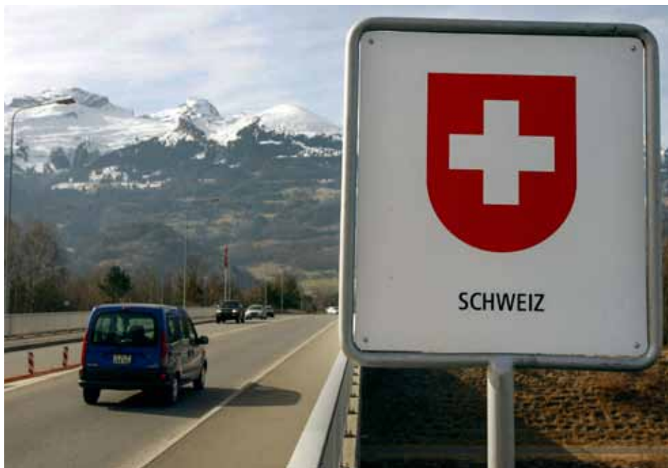
Dank der Personenfreizügigkeit wurde die Expansion unternehmerischer Tätigkeiten weniger als in vergangenen Aufschwungphasen durch Engpässe bei der Rekrutierung von Fachkräften begrenzt. Ab 2011 zeigt sich eine gewisse Verschiebung bezüglich der Herkunft der Personen, welche in die Schweiz einwanderten.