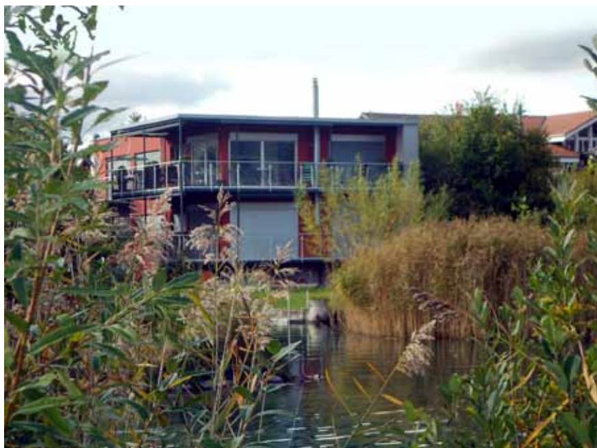
L'utilisation renforcée du milieu bâti accroît la pression sur les espaces non construits. C'est surtout le cas dans l'espace urbain, comme à Thoune.