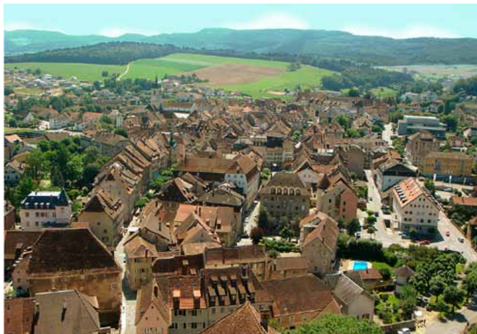
La qualité de l'habitat et l'offre de logements dans les centres sont des défis que doivent relever tant les agglomérations que les petites villes comme Porrentruy.

Les centres des localités sont confrontés à deux problèmes: la ségrégation et l'exode. L'augmentation des coûts contraint des habitants établis de longue date à s'installer en périphérie, laissant leur place à des classes plus aisées et à d'autres affectations. Au lieu d'utiliser de manière optimale des centres déjà denses et souvent bien desservis, on poursuit l'étalement urbain en périphérie, aux dépens des terres cultivées et des espaces naturels. Les projets-modèles de Fontenais et de Porrentruy, dans le canton du Jura, représentent une contribution concrète au développement territorial durable.