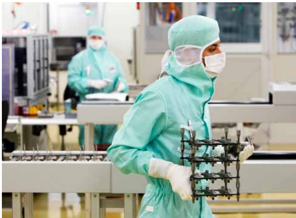
Von der Personenfreizügigkeit ist nicht in allen Fällen eine Reduktion des Fachkräftemangels zu erwarten. Aber sie kann zu einem Wachstum an entsprechenden Arbeitsplätzen führen, das ohne Freizügigkeit wegen der zu hohen Löhne in der Schweiz nicht in diesem Ausmass stattgefunden hätte. Im Bild: Halbleiterproduktion bei ABB.

Schweizer Betriebe haben schon seit längerer Zeit erhebliche Probleme, genügend qualifizierte Fachkräfte zu rekrutieren. Seit der Einführung der Personenfreizügigkeit im Jahr 2002 ist es für Betriebe prinzipiell einfacher geworden, auf Fachkräfte aus dem EU-Raum zurückzugreifen. Die vorliegende Analyse zeigt, dass sich das generelle Niveau des Fachkräftemangels zwischen 2000 und 2009 zwar nicht verändert hat, dass es aber ohne Personenfreizügigkeit im Jahr 2009 wohl sichtbar höher gelegen wäre. So hat sich der Fachkräftemangel bei jenen Betrieben, die im Jahr 2000 noch über grosse Schwierigkeiten klagten, an Arbeitsbewilligungen für ausländische Fachkräfte zu gelangen, bis 2009 deutlich zurückgebildet.